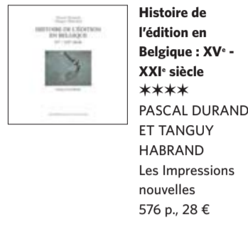
Histoire de l'édition en Belgique : XV e -XXI e siècle **** PASCAL DURANT ET TANGUY HABRAND Les Impressions nouvelles 576 p., 28 €

T.H. Je pense à l'édition littéraire de l'entre-deux-guerres, que les archives de La Renaissance du Livre ont aidée à sortir de l'ombre. On associe géné-